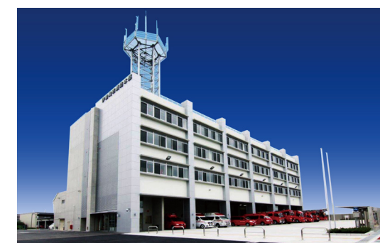
伊勢崎市消防本部庁舎新築給排水衛生設備工事