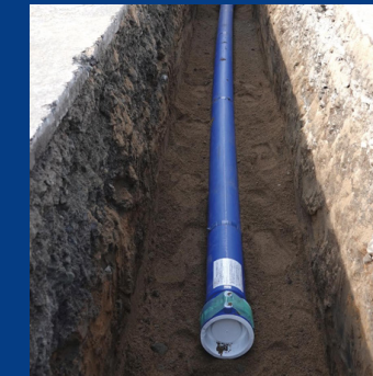
上水道管布設工事