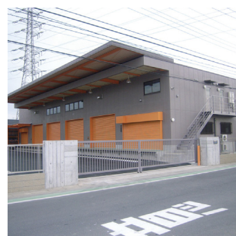
倉庫・事務所新築工事