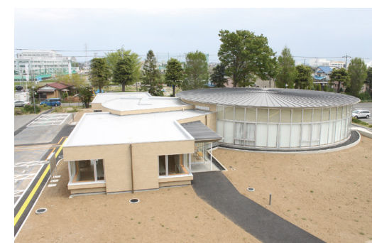
緋の郷円形交流館改築機械設備工事